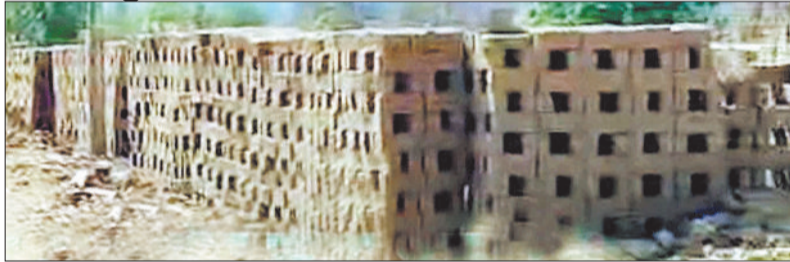
अवैध ईट भट्टा।