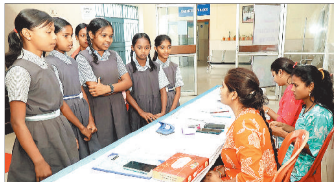
छात्राओं को जानकारी देती विशेषज्ञ।

के प्रति अपनी प्रतिबद्धता को सुदृढ़ करते हुए बालिका सशक्तिकरण अभियान का संचालन कर रहा है। यह पहल बालिकाओं को शिक्षा, जागरूकता एवं समग्र विकास के माध्यम से सशक्त बनाने के उद्देश्य से चलाई जा रही है। एनटीपीसी कोरबा का बालिका सशक्तिकरण अभियान बालिकाओं में आत्मविश्वास, नेतृत्व क्षमता एवं जीवन कौशल विकसित करने के