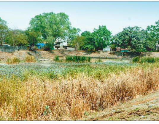
मंगला का तालाब सूखा, पानी के लिए भटक रहे लोग।

शहर के मंगला वार्ड क्रमांक 13 में पीने के पानी को लेकर हालात चिंताजनक हो गए हैं। लोग सुबह-शाम पानी के इंतजार में परेशान हो रहे हैं। जानकारी के अनुसार मंगला की दीनदयाल कॉलोनी सेक्टर-3 और सेक्टर-4 की टंकी, अलखधाम का मोटर, धुरीपारा तालाब का मोटर, वार्ड कार्यालय के पास लगा मोटर तथा अटल चौक मंगला का मोटर खराब पड़ा हुआ है। इन मोटरों के बंद होने के कारण नियमित जलापूर्ति बाधित हो गई है और कई घरों में पीने के पानी की गंभीर समस्या खड़ी हो गई है।