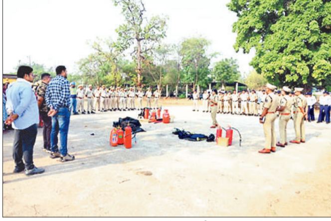
मॉक ड्रिल का प्रदर्शन करते अग्निशमन विभाग के कर्मचारी।