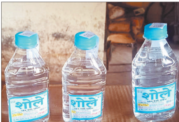
प्लास्टिक की बोतल में देशी शराब।

चुकी है। अब भी जिले की ज्यादातर देशी शराब दुकानों में पर्याप्त स्टॉक नहीं है। जिसकी वजह से देशी शराब प्रेमियों को खाली पेशानियों का सामना करना पड़ रहा है। देशी शराब नहीं मिलने पर मदिरा प्रेमी अब विदेशी शराब की ओर रुख कर रहे हैं। जिसकी वजह से विदेशी शराब की बिक्री में इजाफा हुआ है। उल्लेखनीय है कि आबकारी के