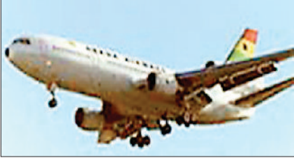
रहा है, जिसके चलते अलायंस एयर की वेबसाइट पर 30 अप्रैल के बाद की फ्लाइट नहीं है। अंबिकापुर से

जल्द ही अंबिकापुर से कोलकाता के लिए चल रही अलायंस एयर की फ्लाइट बंद हो सकती है। मई में फ्लाइट की बुकिंग बंद है। यात्रियों की कमी के चलते फ्लाइट बंद होने की आशंका बनी हुई है, हालांकि इसकी आधिकारिक सूचना नहीं मिली है।